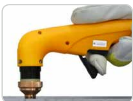
Aufsetzkappe | Contact cap