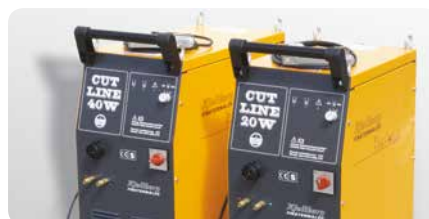
CUTLINE-Reihe | CUTLINE series

The robust units of the CUTLINE series cut all electrically conductive materials with a thickness between 1 and 40 mm using air as plasma gas. The simple, step-switched power sources are equipped with liquid-cooled torches that reduce the consumption of compressed air and consumables considerably.