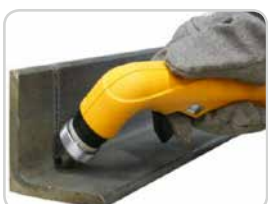
Lange Verschleißteile Long consumables