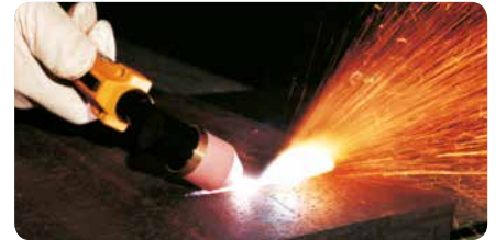
Plasmafugen zur Vorbereitung von Schweißnähten Plasma gouging for weld preparation purposes

A large variety of accessories is available for the flexible use of the CUTi and CUTLINE units.