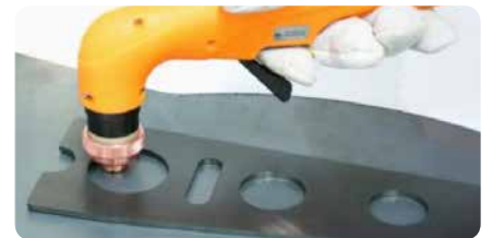
Schablonnenschnitte | Template cuts