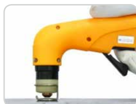
Distanzfeder | Spacer spring