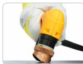
Fasenkronen | Beveling cap