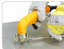
Kreisschneideeinrichtung Circle cutting device