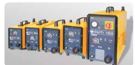
CUTi-Reihe | CUTi series