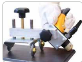
Fasenschneideeinrichtung Bevel cutting device