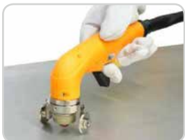
Räderwagen | Wheel guide